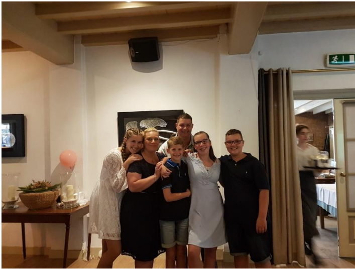
Dit is mijn familie