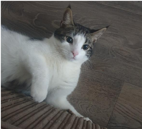
Dit is mijn poes sky