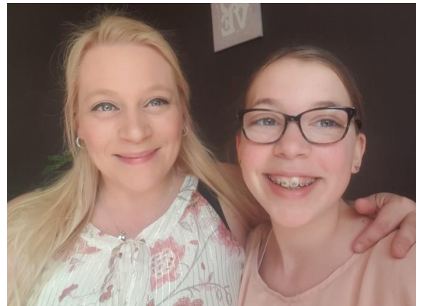
Dit ben ik naast mijn moeder