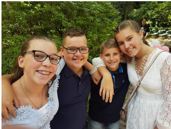
Dit ben ik naast mijn broertjes en zus